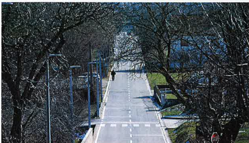
Vrlika iz dana u dan ima sve porazniju demografsku sliku, više se čuje brećanje od prvog dječjeg plača