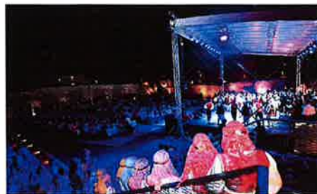
Članovi KUD-a 'Salona' na pozornici

dobru zabavu i neponovljiva iskustva – poručuju iz KUDA "Salona", a mogu se upisati online zaključno s 20. studenoga ove godine. Nakon upisa zainteresirani će biti pozvani na audiciju, a za sve dodatne informacije možete se obratiti na brojeve mobitela 091/ 525 34 80 i 098/ 980 95 03 te na e-mail adresu kudsalonasolin@gmail.com , a o svemu se može pročitati i na Facebook stranici ovog kulturno-umjetničkog društva, kao i Grada Solina. OM. SE.